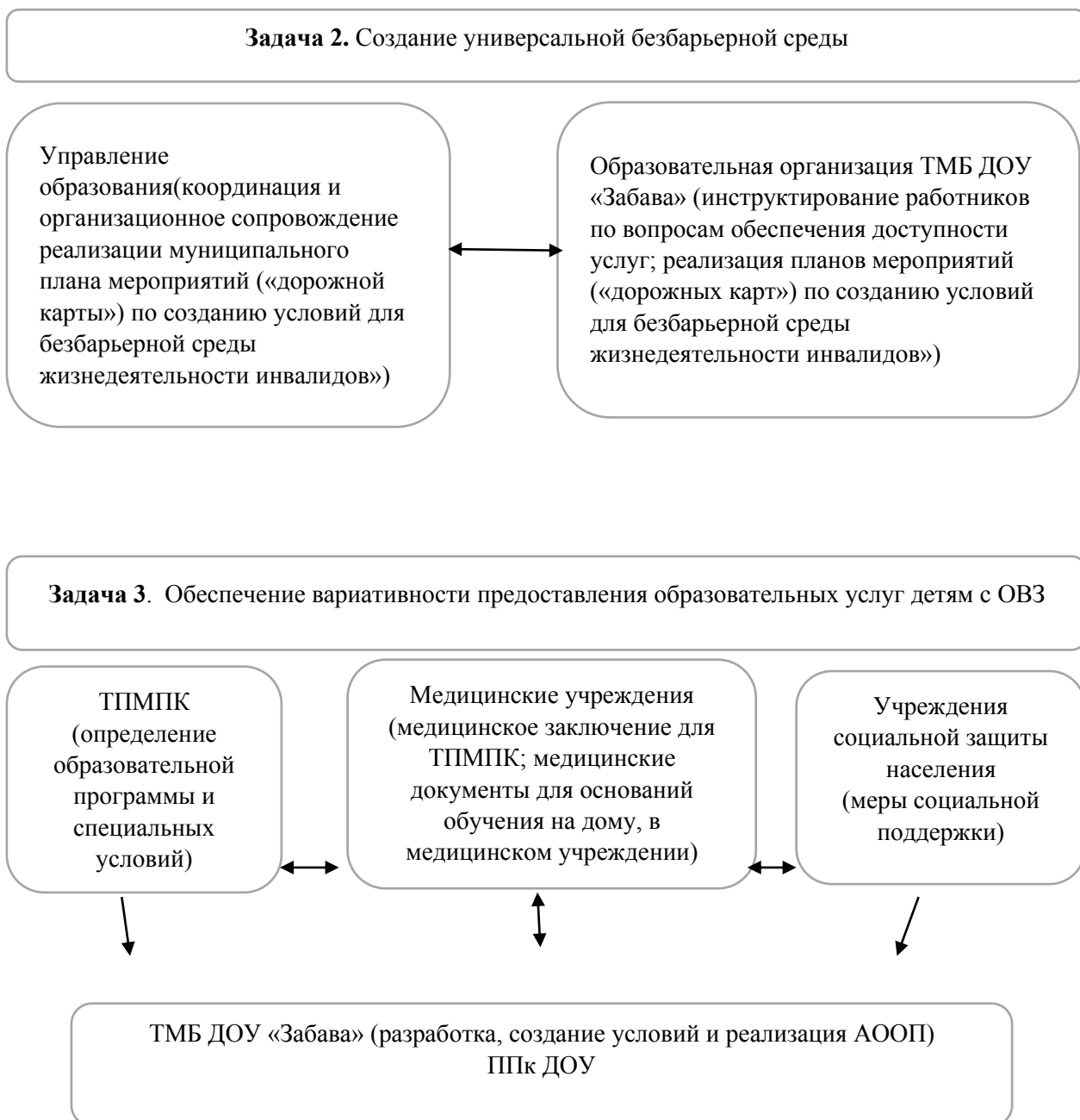
Схема взаимосвязи и взаимозависимости между организациями и структурами муниципального района