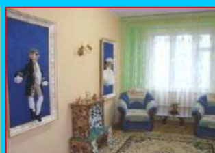
Мини-центр «Семейный очаг»