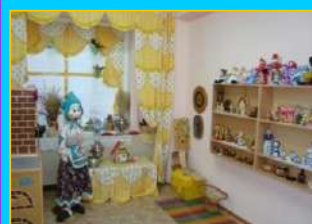
Уголок «Русская изба»